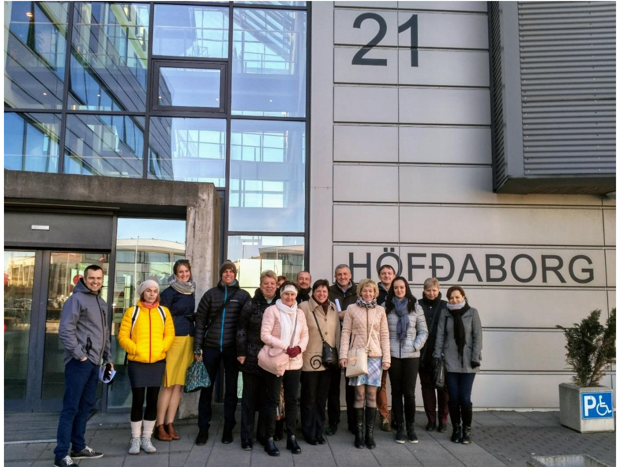
Foto: Společná fotografie před islandskou Vládní agenturou pro ochranu dětí, Zlínský kraj