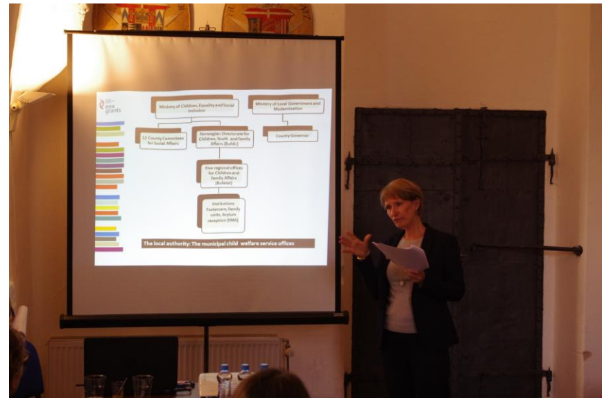
Foto: Zleva prezentace Bufdir k systému péče v Norsku, workshop v Praze, Kruh rodiny, o.p.s.