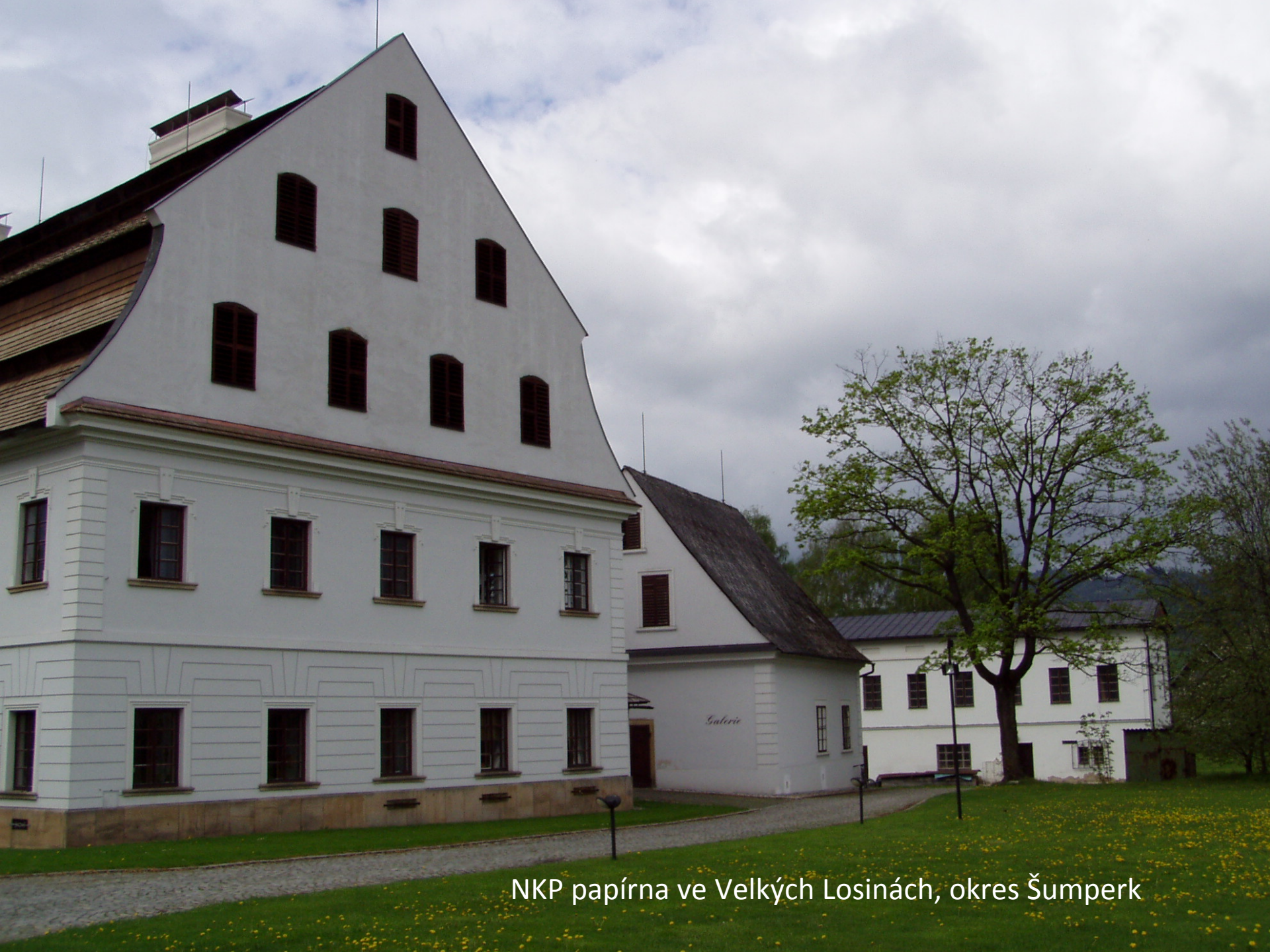
NKP papírna ve Velkých Losinách, okres Šumperk