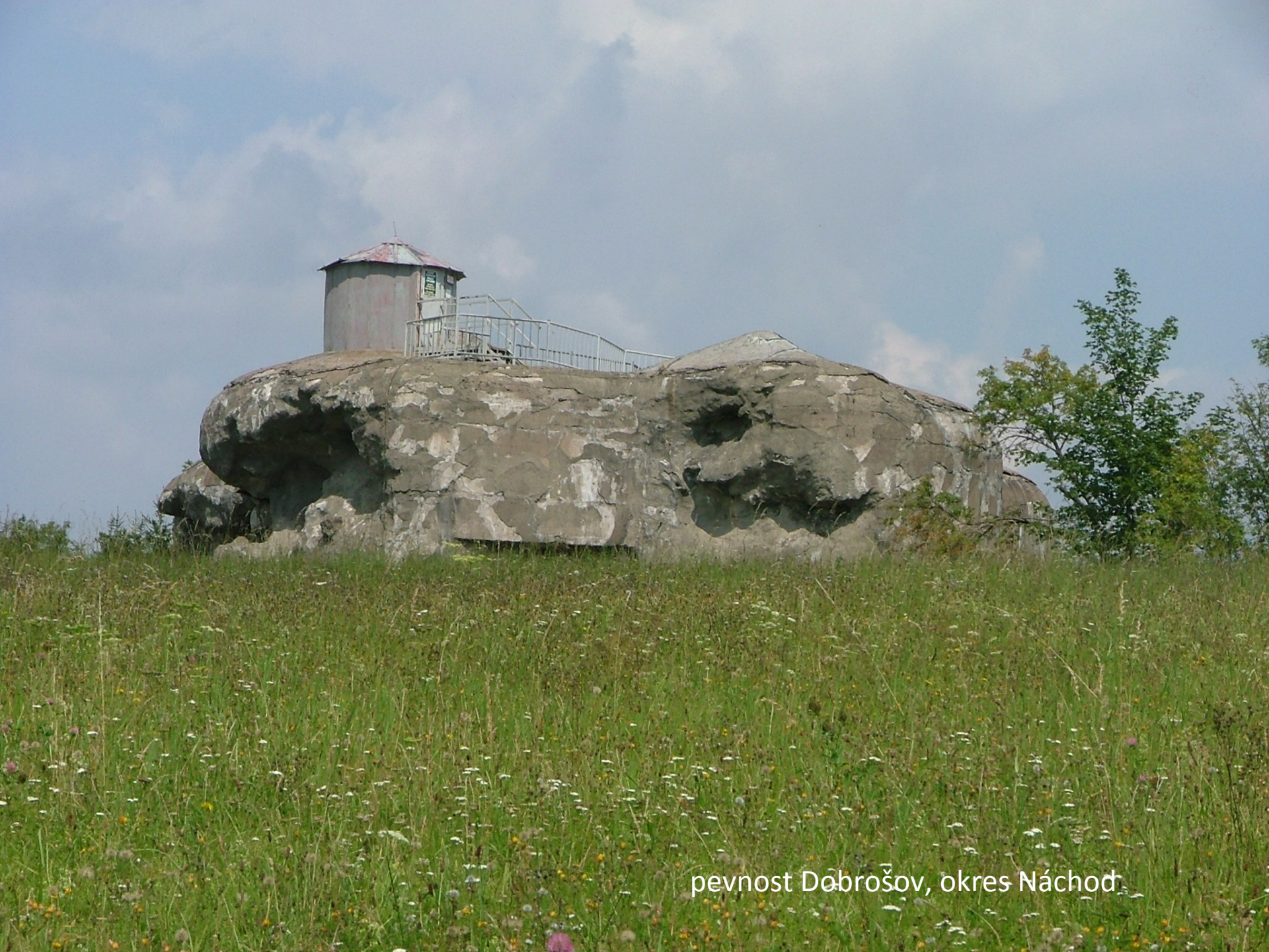
pevnost Děbrošov, okres Náchod