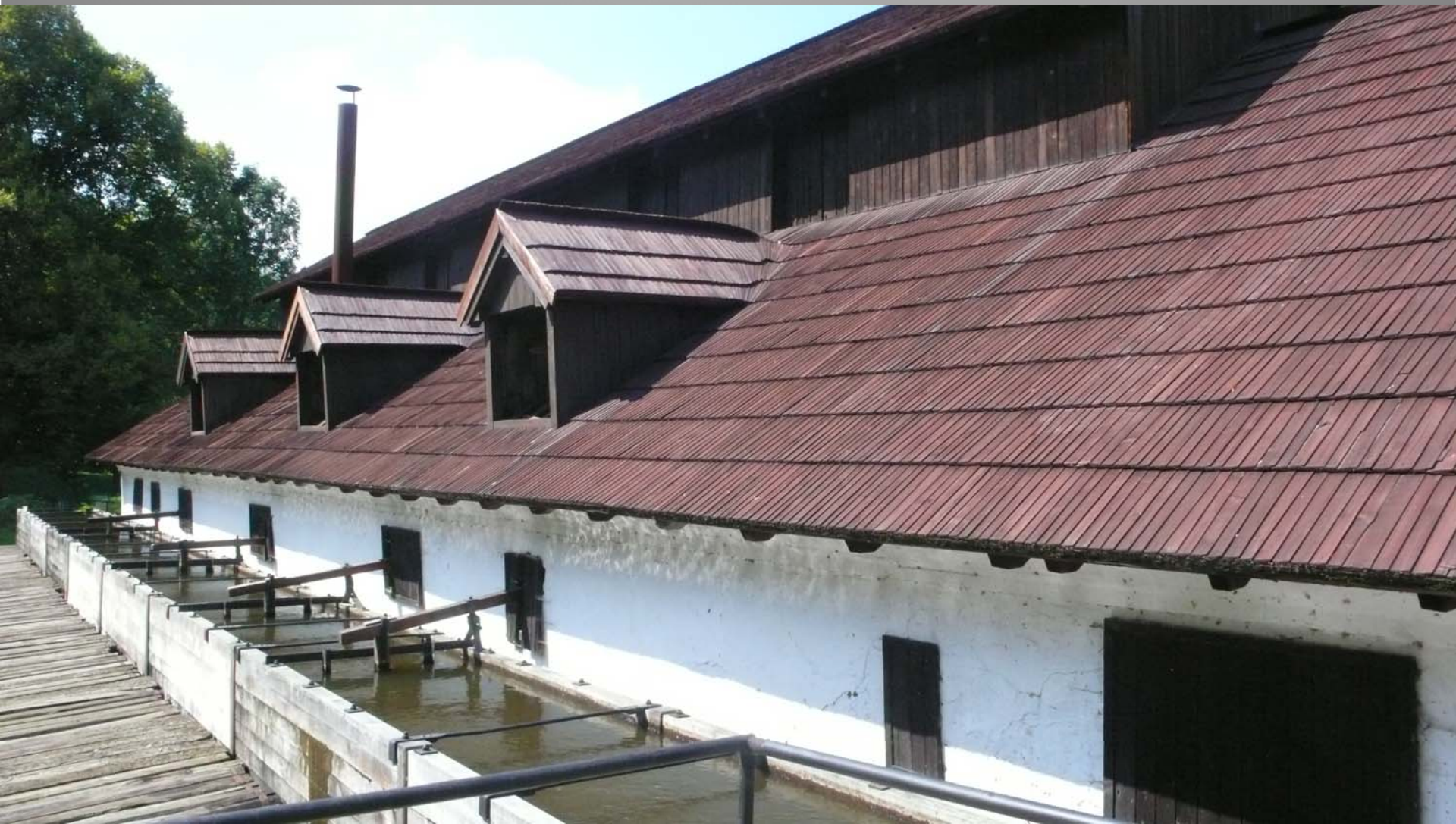
hamr Dobřív, okres Rokycany