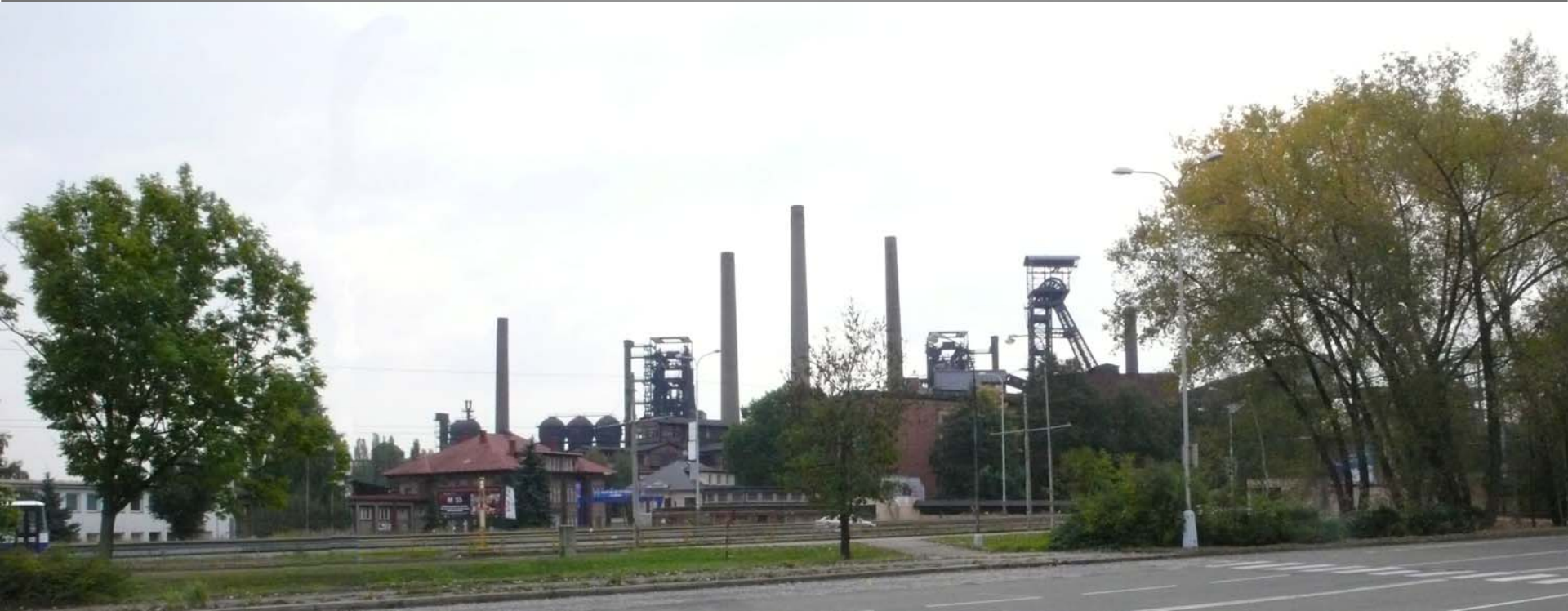
Vítkovické železárny, Ostrava - Vítkovice