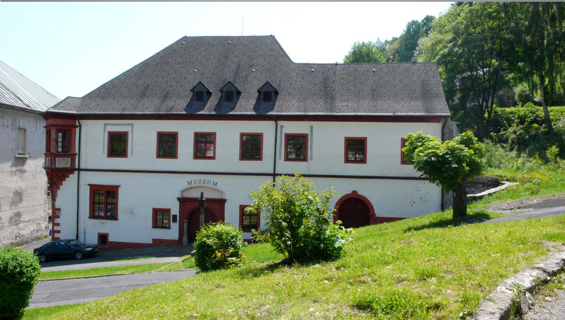
mincovna v Jáchymově, okres Karlovy Vary