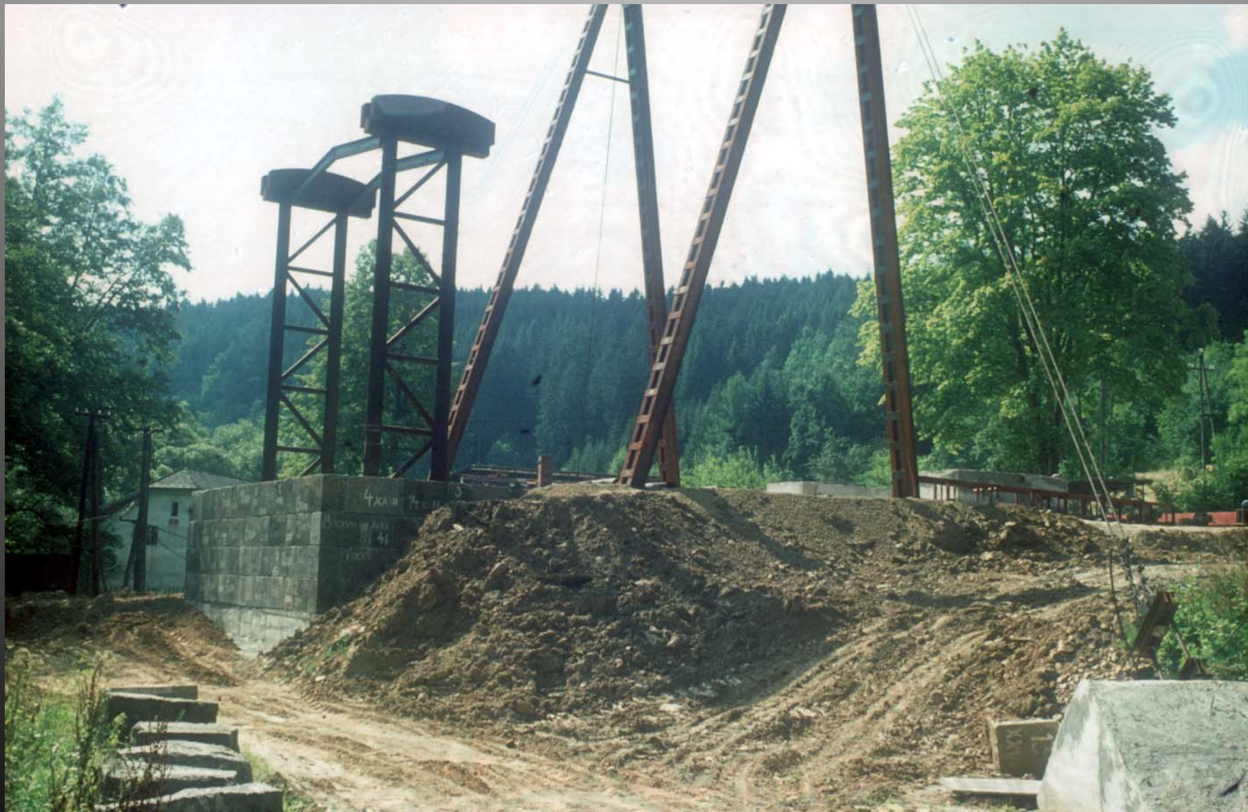
NKP most ve Stádleci, okres Tábor, transfer mostu