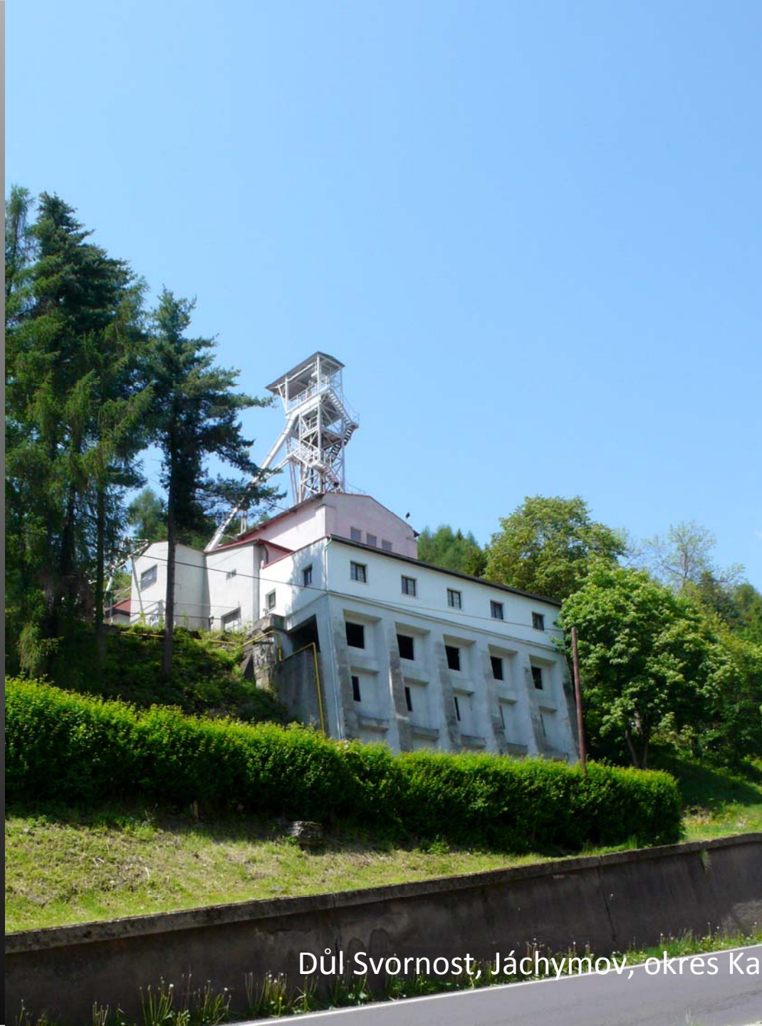
Důl Svornost, Jáchymov, okres Karlovy Vary