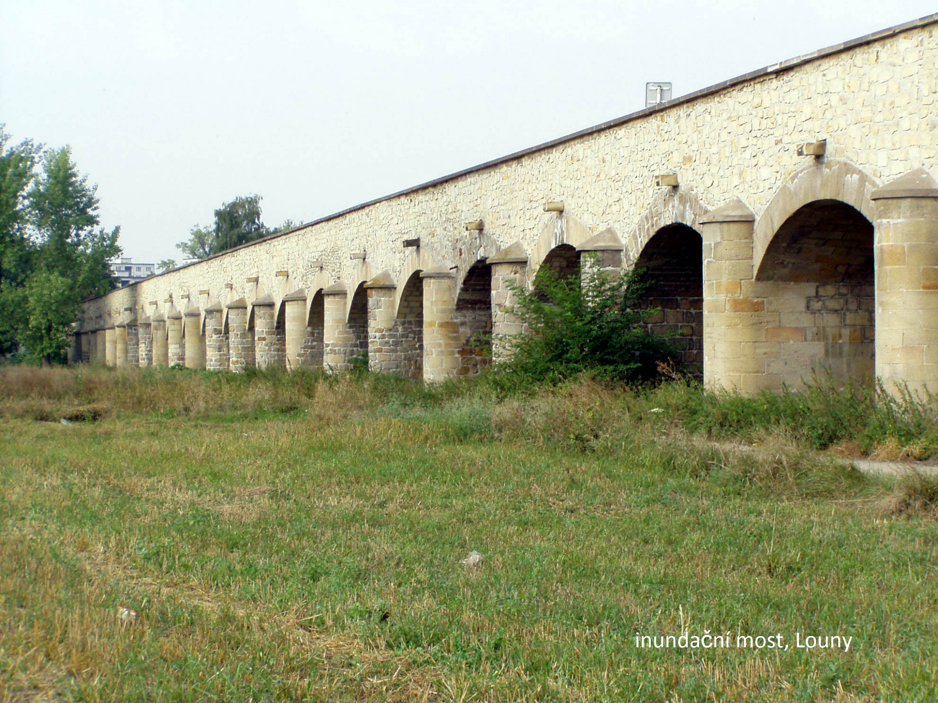
inundační most, Louny