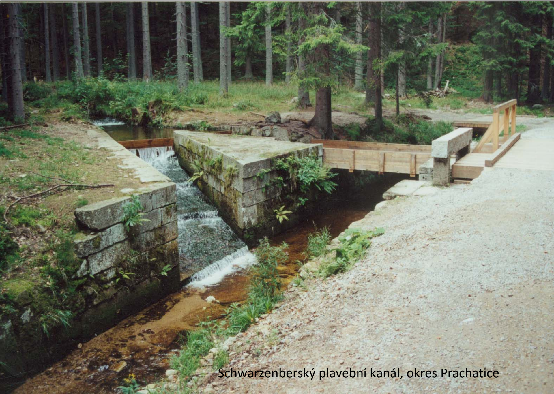
Schwarzenberský plavební kanál, okres Prachatice