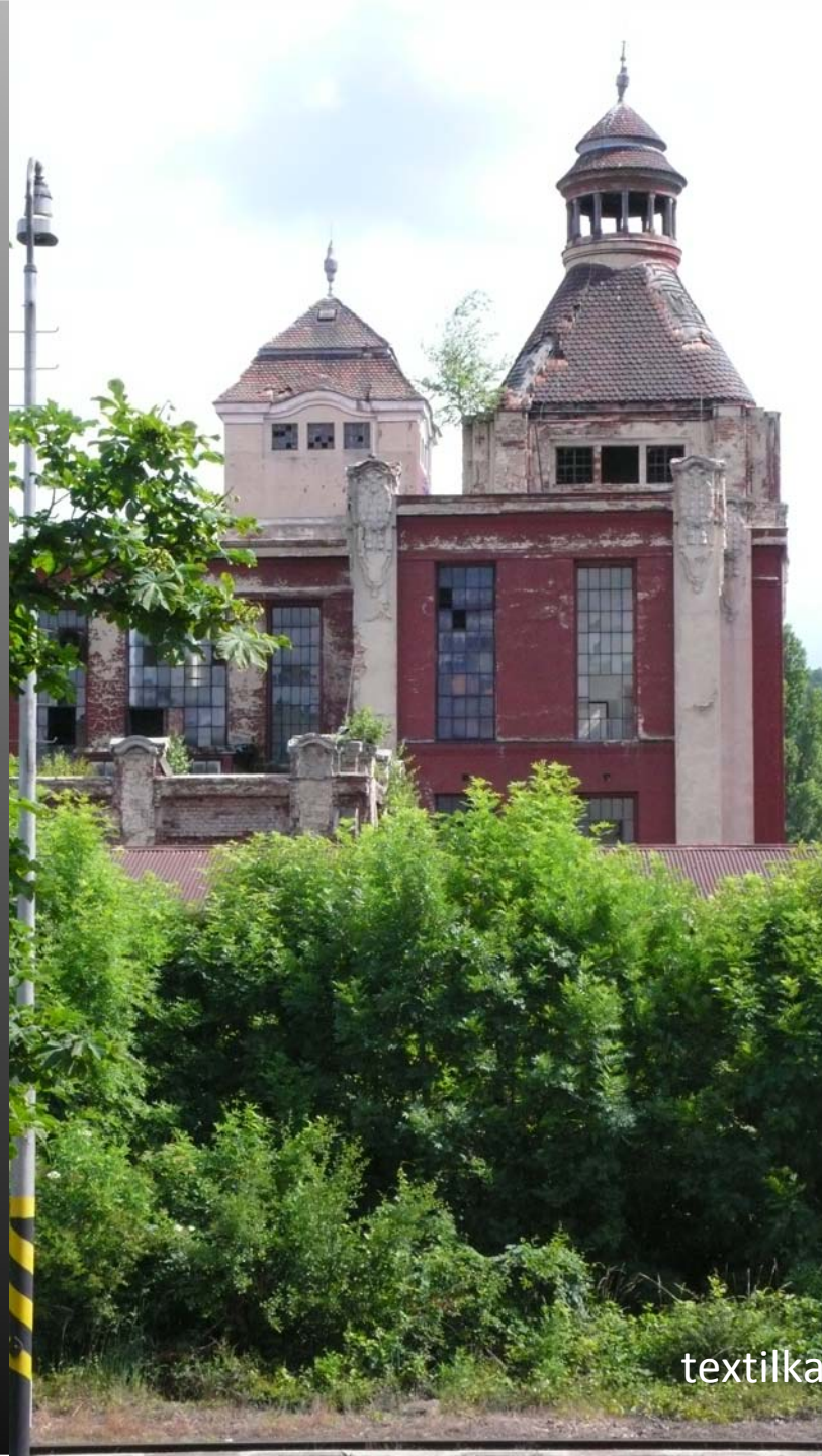
textilka Bystřany, okres Teplice