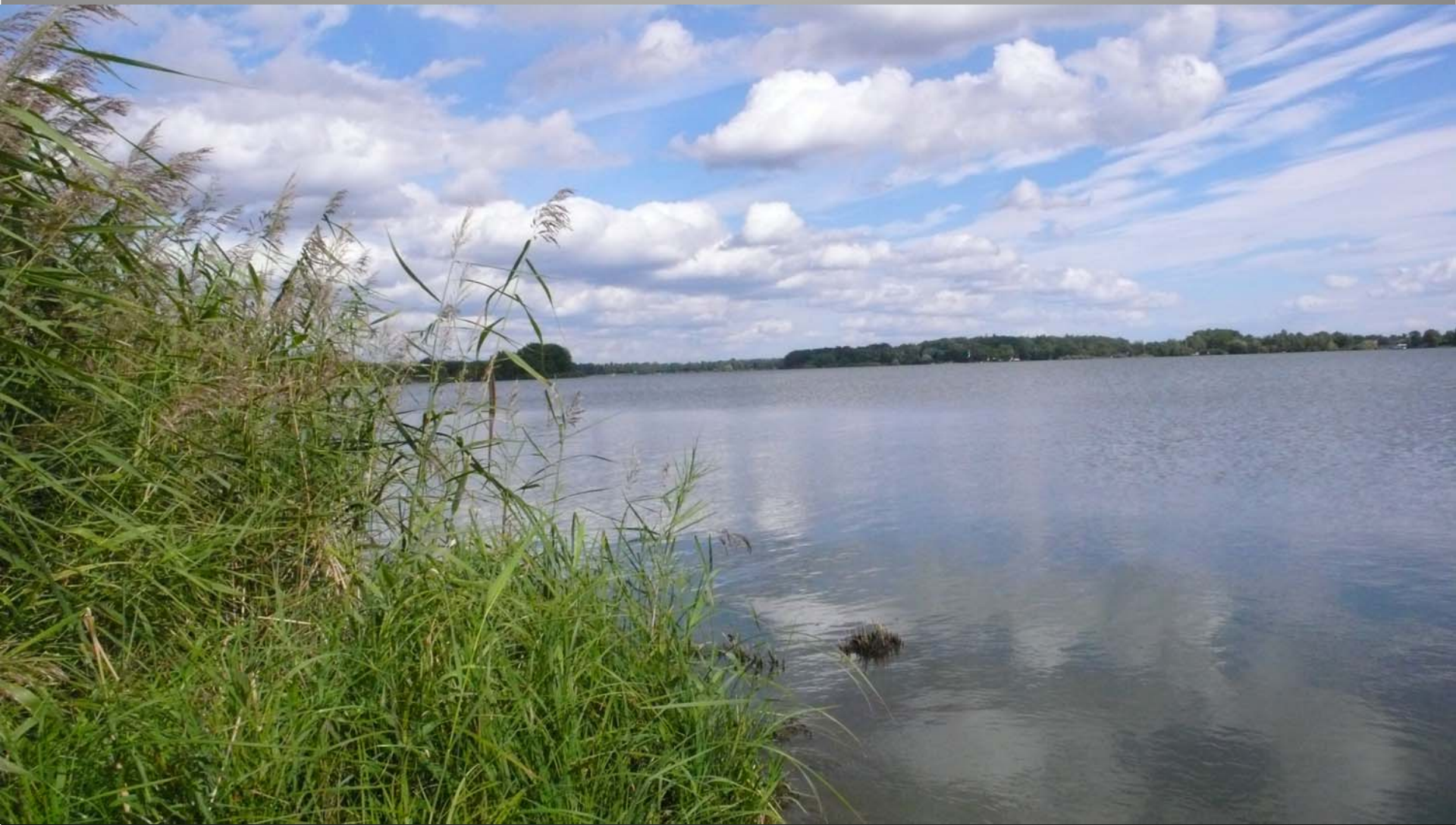
NKP rybník Svět, Třeboň, okres Jindřichův Hradec