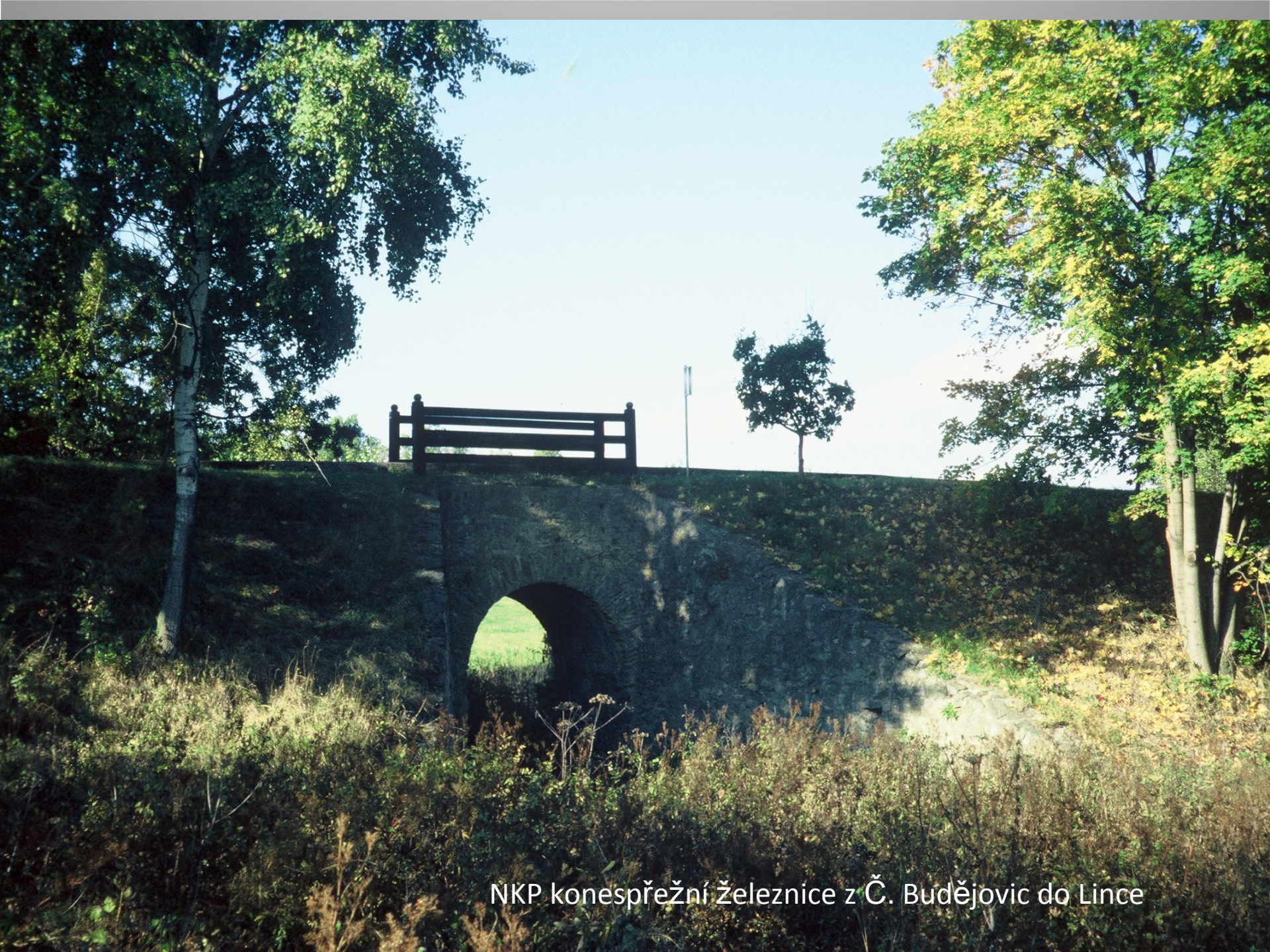
NKP konesprežní železnice z Č. Budějovic do Lince