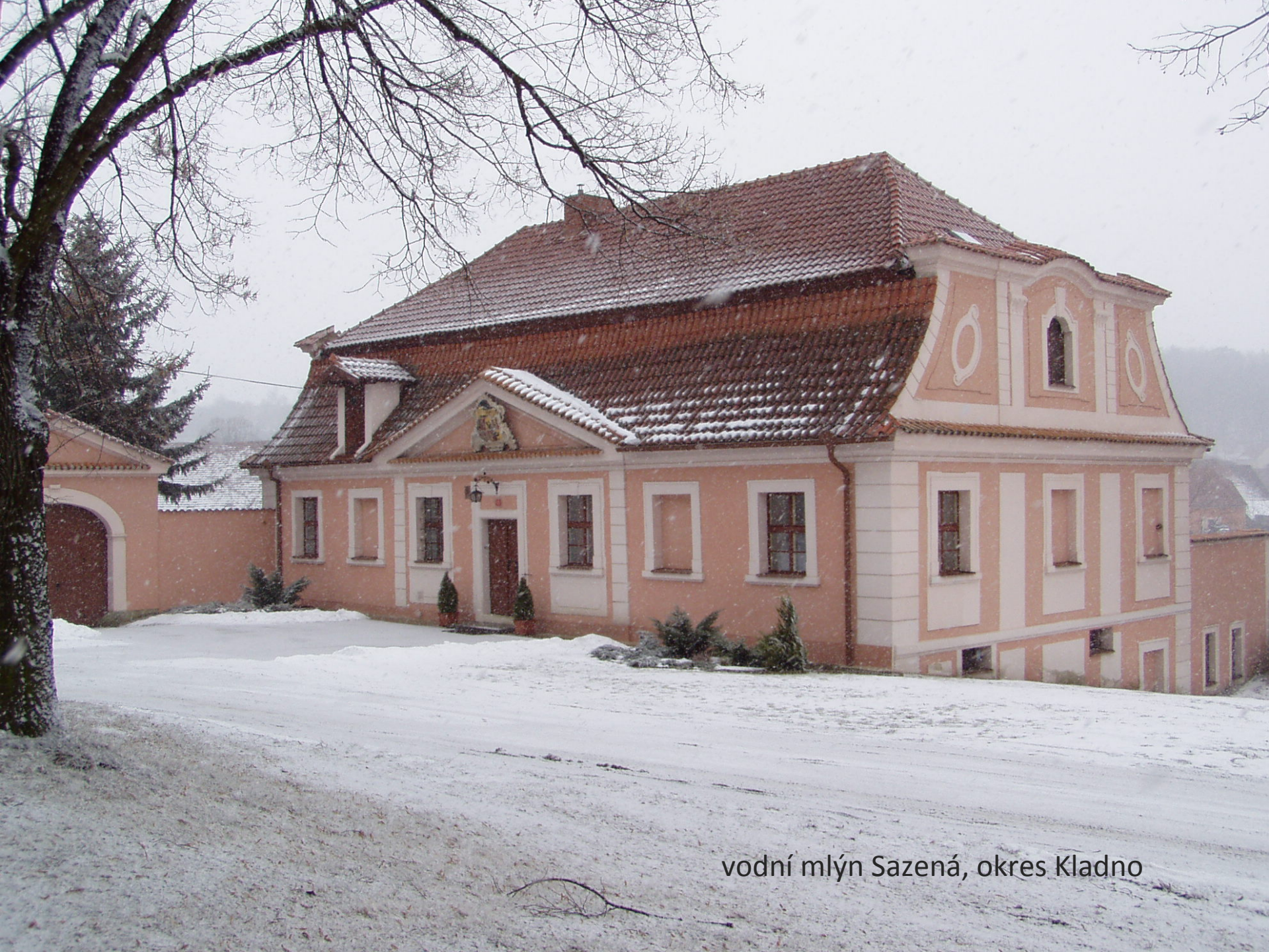
vodní mlýn Sazená, okres Kladno