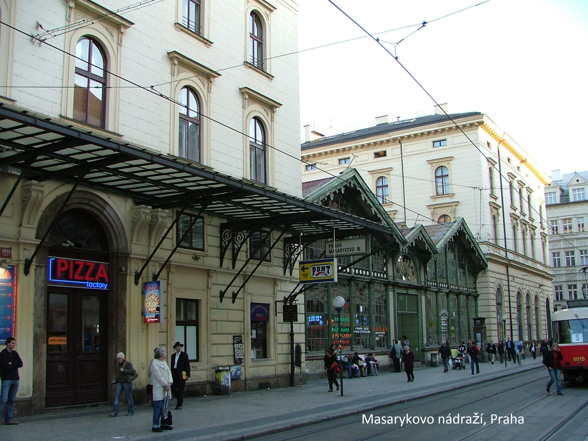
Masarykovo nádraží, Praha