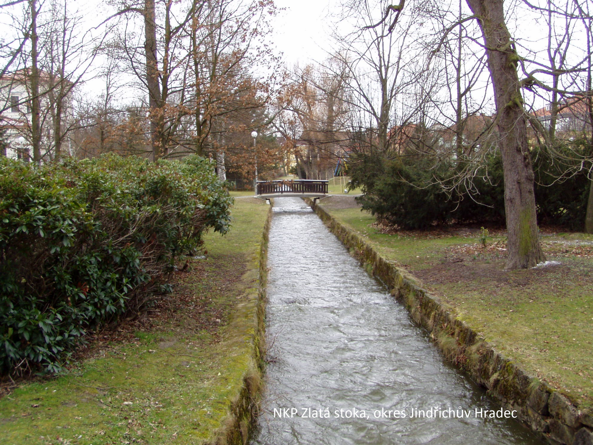
NKP Zlatá stoka, okres Jindřichův Hradec