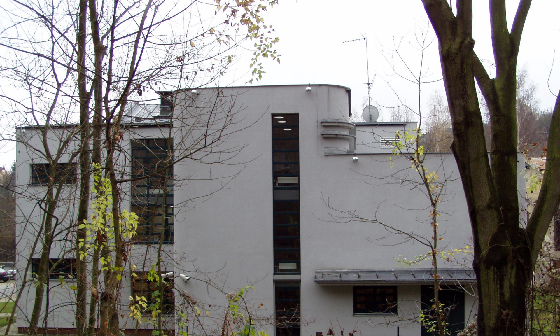
Hydroxygen, Praha - Hlubočepy