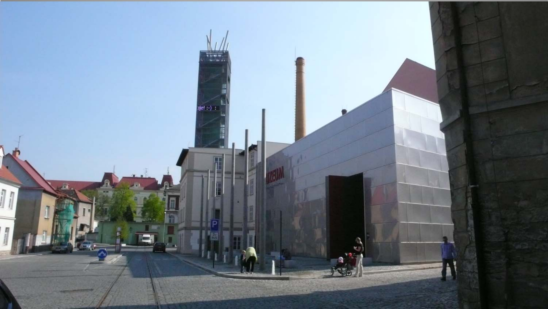
Chrám chmele a piva, Žatec, okres Louny