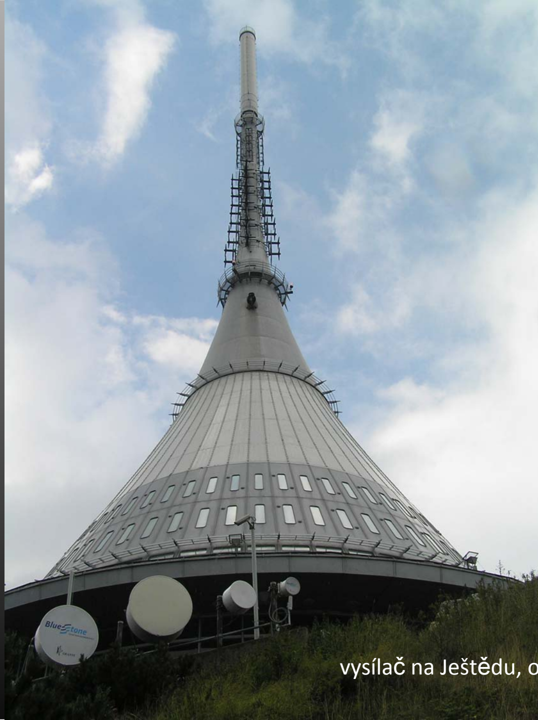
vysílač na Ještědu, okres Liberec