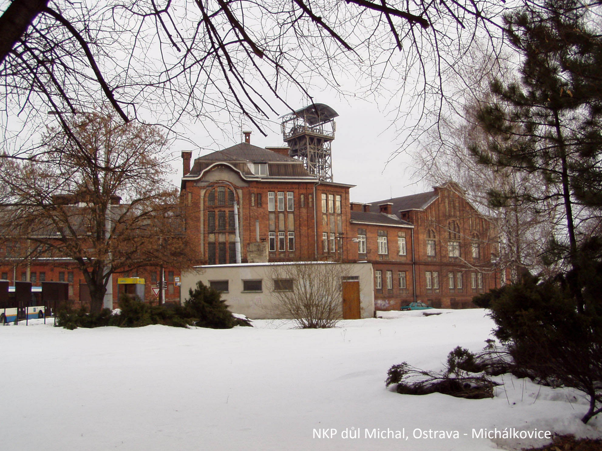
NKP důl Michal, Ostrava - Michálkovice