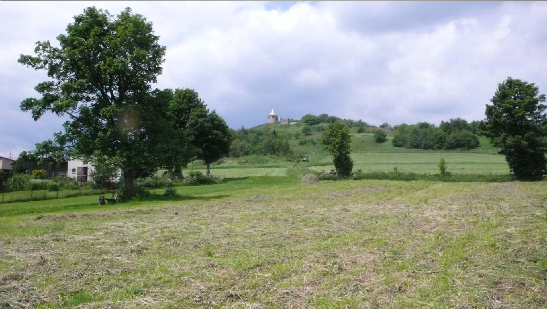
Měděnec, okres Chomutov