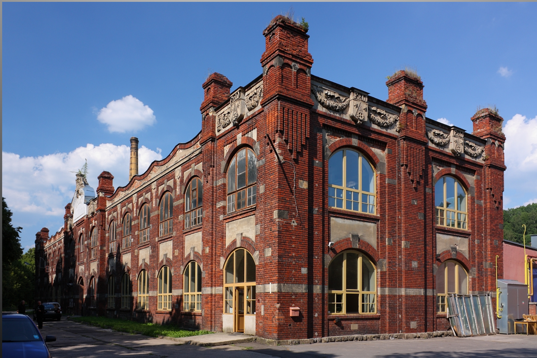
textilka Chrastava – Andělská hora, okres Liberec