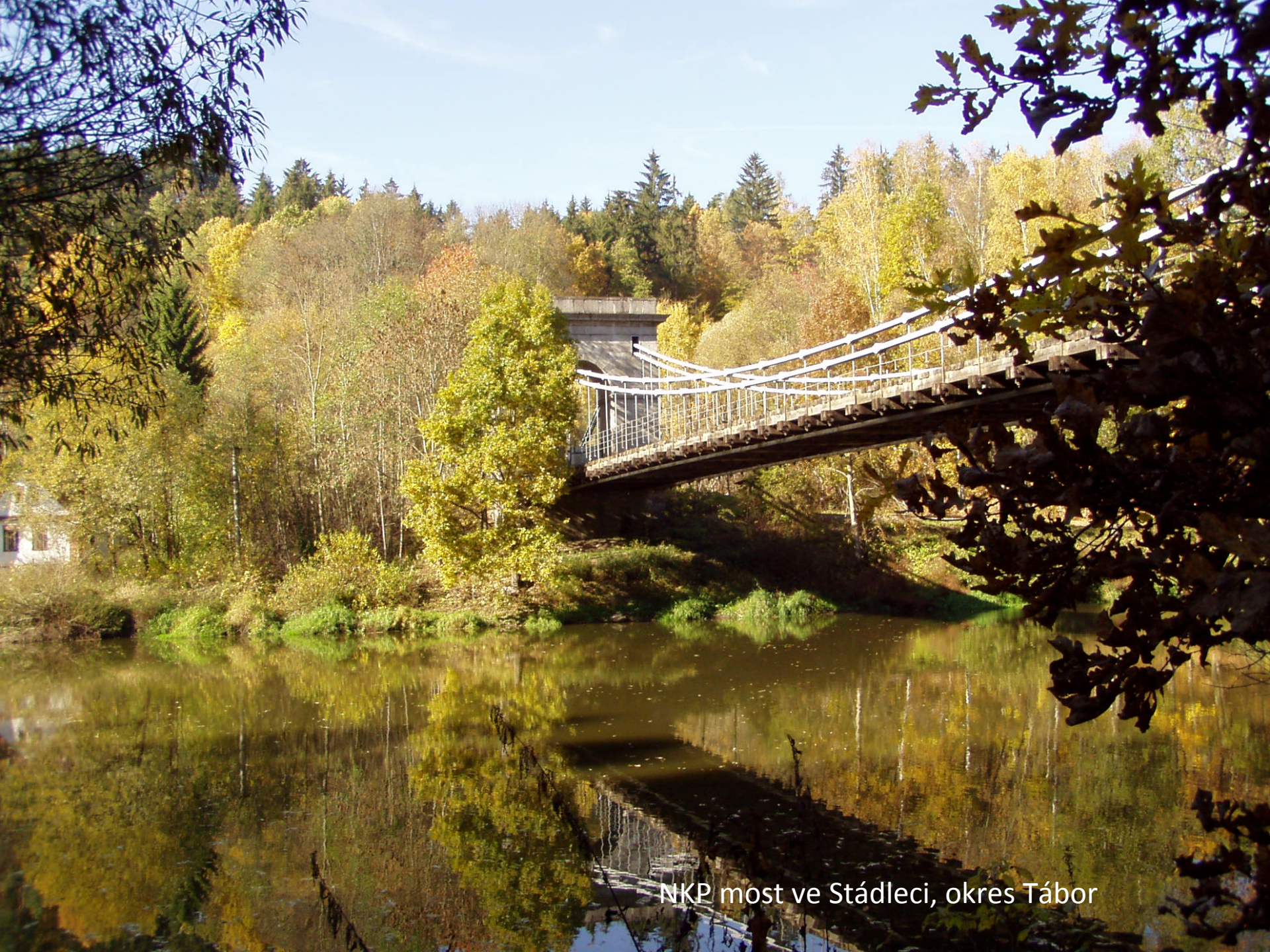
NKP most ve Stádleci, okres Tábor