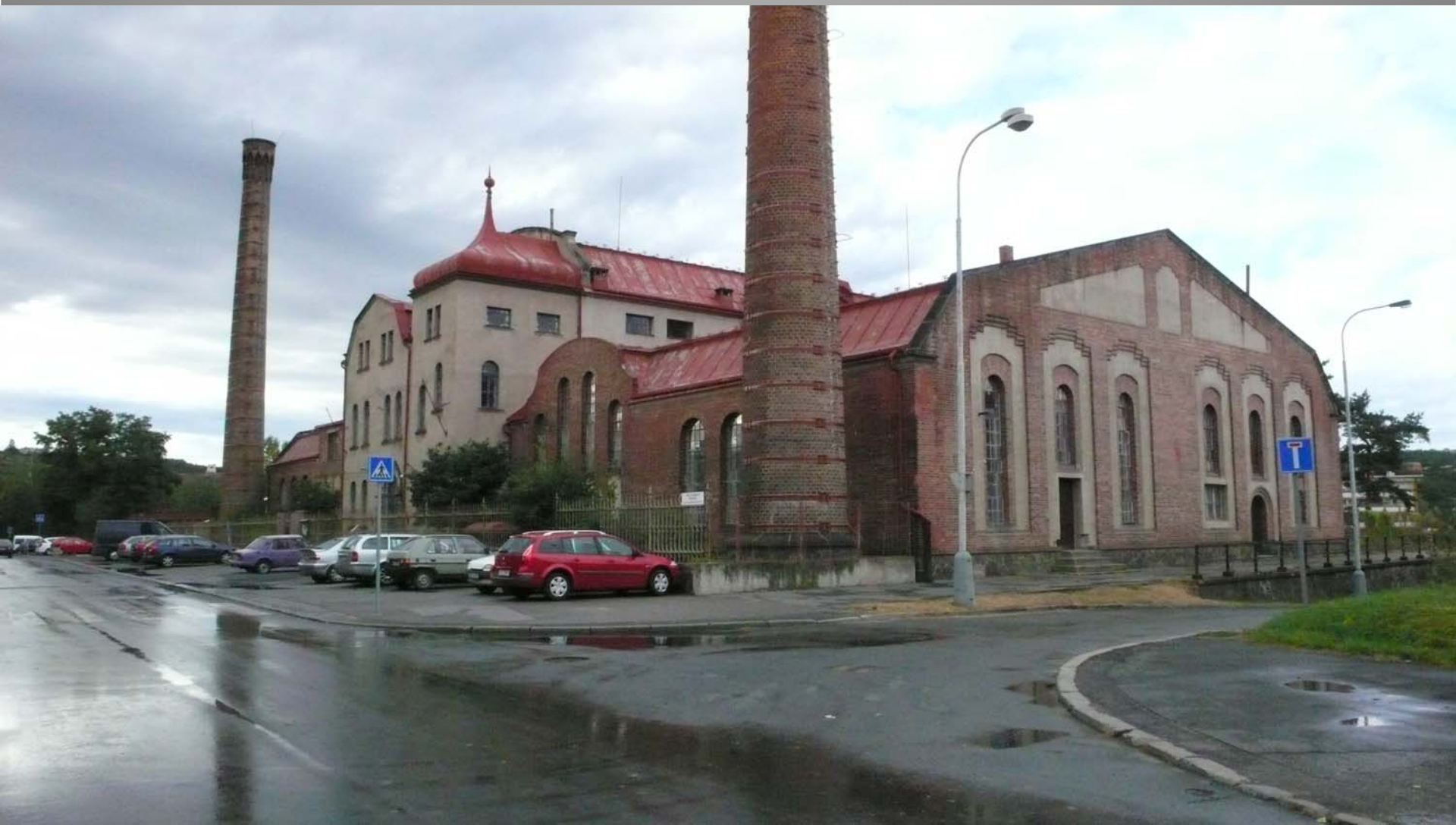
Čistírna odpadních vod Praha Bubeneč