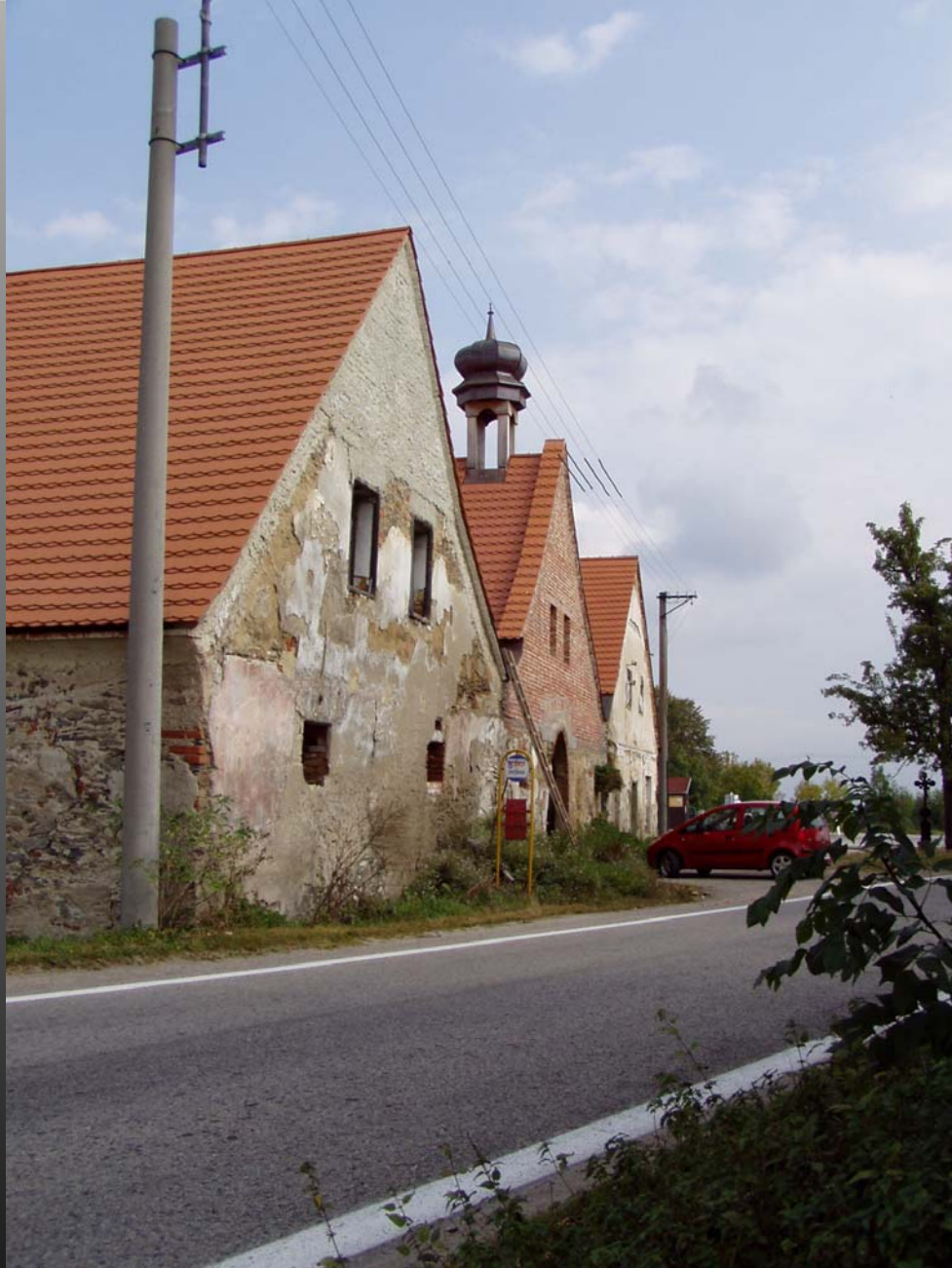
NKP konesprežní železnice z Č. Budějovic do Lince