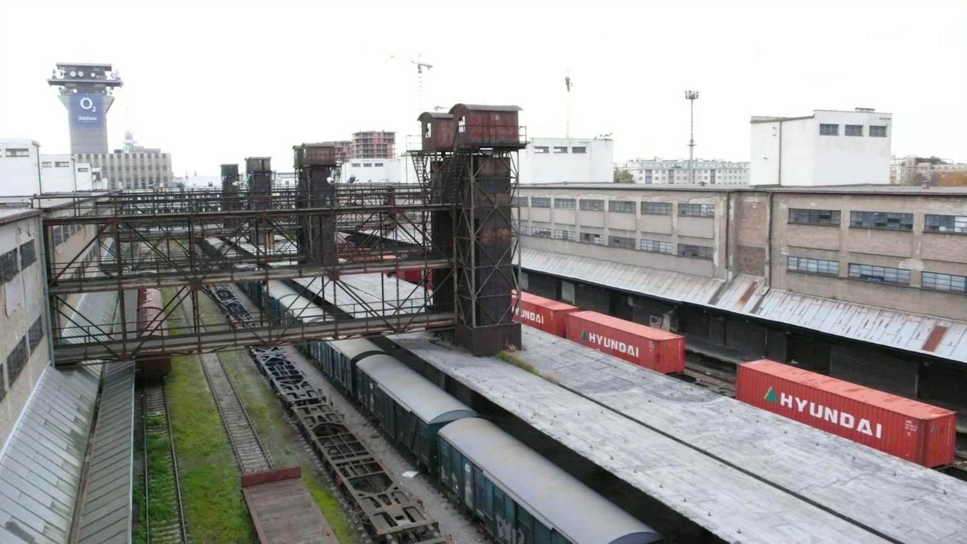
nákladové nádraží Praha - Žižkov